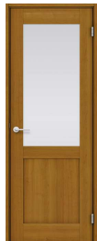
ミスト熱処理ガラス