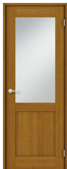
カスミ熱処理ガラス