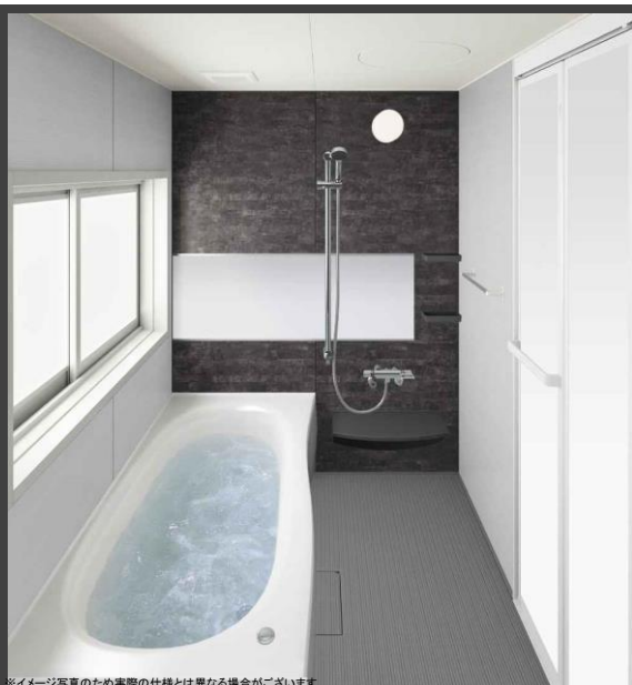
※イメージ写真のため実際の仕様とは異なる場合がございます。