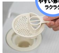
樹脂製 片側取っ手付き